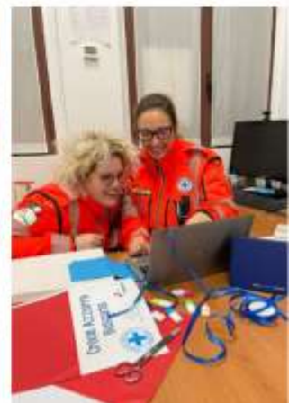
Raccolta di alcune delle fotografie più significative dell'anno 2022