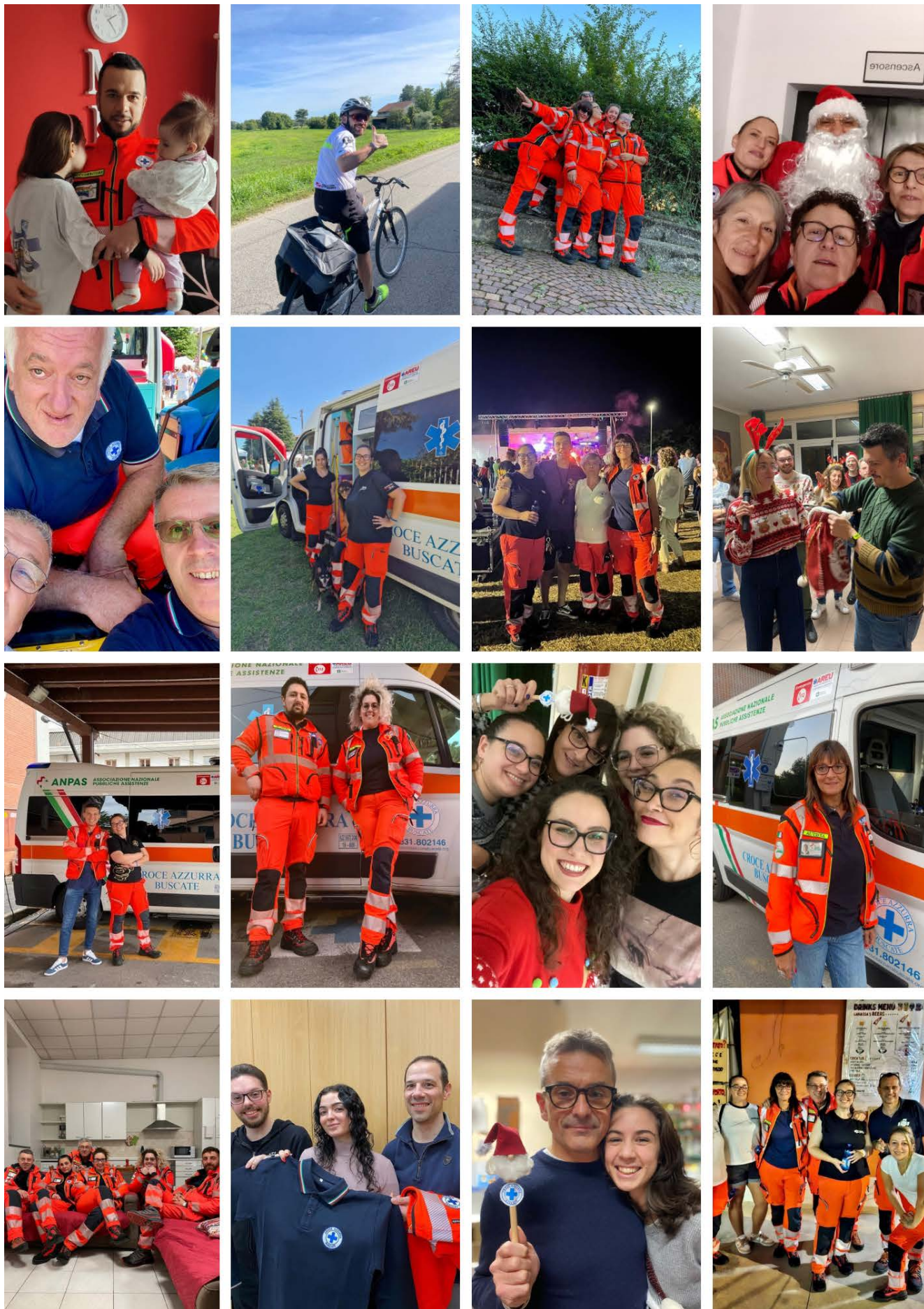
Raccolta di alcune delle fotografie più significative dell'anno 2023